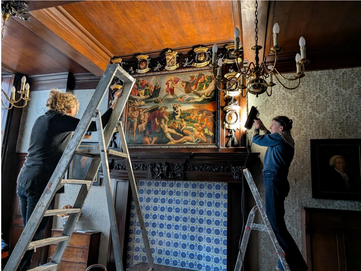
Onderzoek naar de toestand van de wapenschilden en het schilderij met Het Laatste Oordeel, december 2025