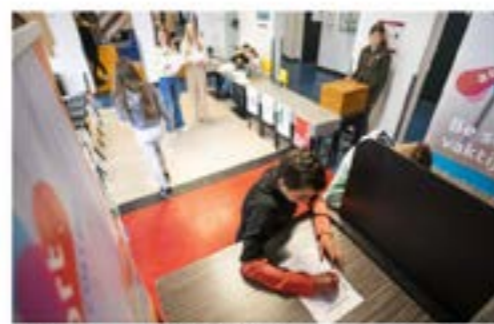
Leerlingen van het Amsfort College brengen hun stem uit voor de Scholierenverkiezingen.