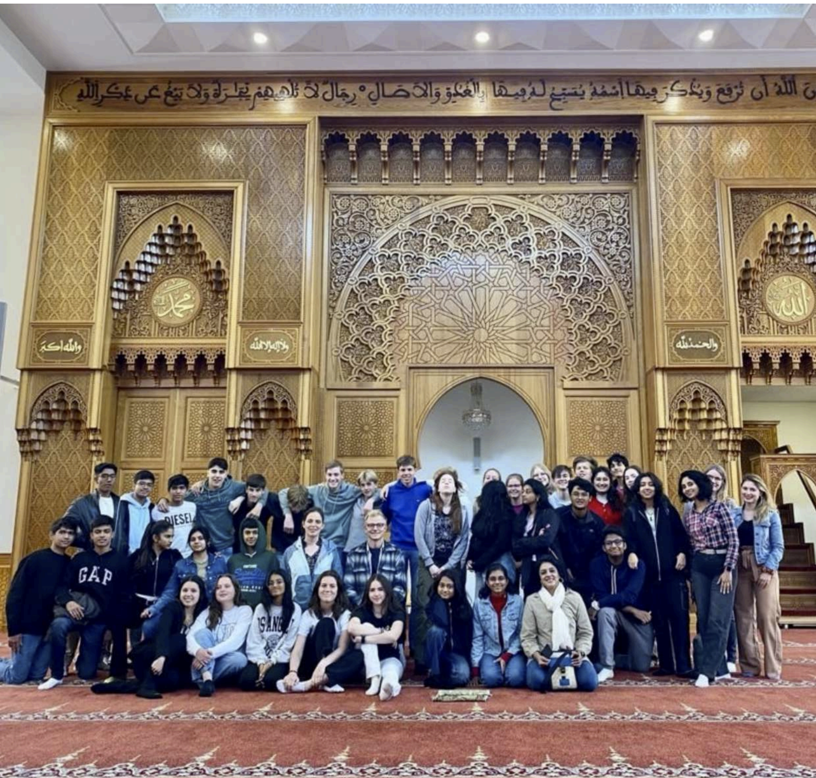
De eerste tweetalige M25 dag met uitwisseling tussen leerlingen uit Mumbai, India en het Rijnlands Lyceum Oegstgeest in de Al Hijra Moskee in Leiden.